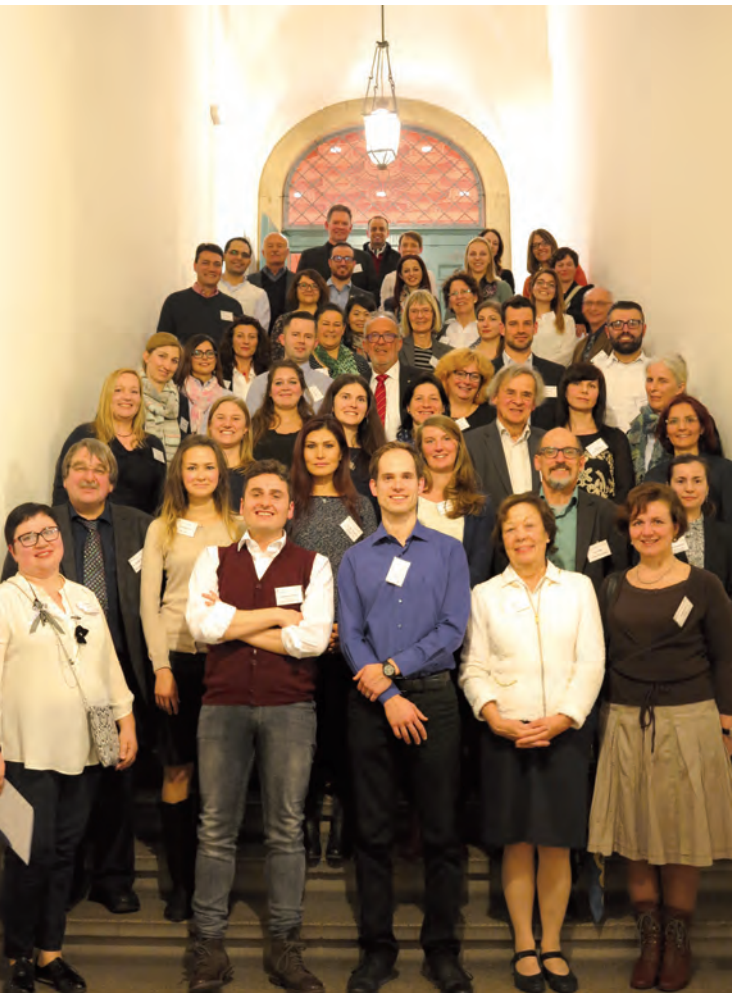
Mentor/innen und Mentees - Auftaktveranstaltung im Augsburger Rathaus